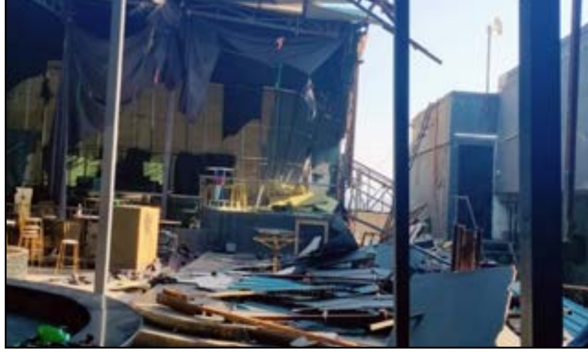
(कल्याणीनगर) युनिकॉर्न पोलिसांनी कारवाई बांधकाम विभागानेही एलरो आणि एलरो पबवर पुणे केल्यानंतर महापालिकेच्या पबवर शनिवारी कारवाई

मात्र त्या नंतरही रात्री उशीरापर्यंत सुरु राहत होते. यासंदर्भात तक्रारी आल्यानंतर गुन्हे शाखेच्या सामाजिक सुरक्षा विभागाने कल्याणी नगर येथील युनिकॉर्न हाऊस व एलरो या पबवर कारवाई करत २८ लाखाचा मुद्देमाल जप्त करत ८ जणांवर गुन्हा दाखल केला होता. येरवड्यातील